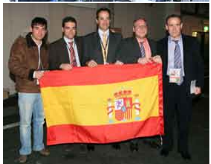
Representantes de Mercedes-Benz España