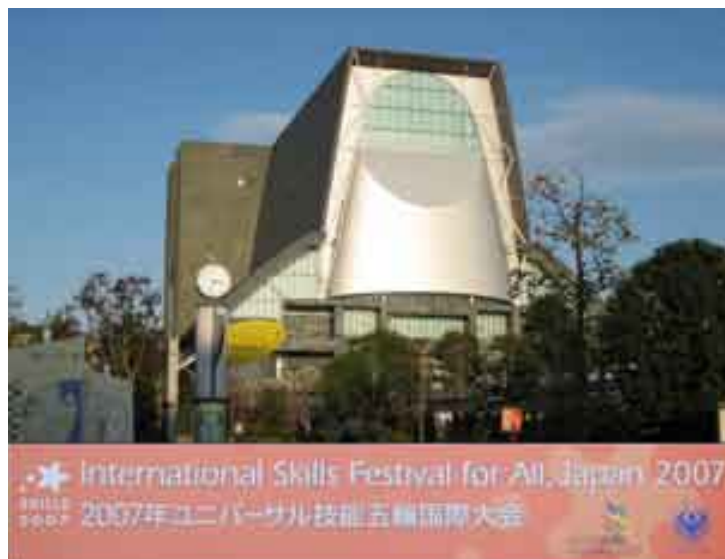
Shizuoka Convention & Arts Center Granship