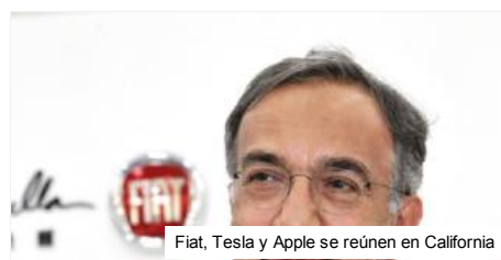
Fiat, Tesla y Apple se reúnen en California