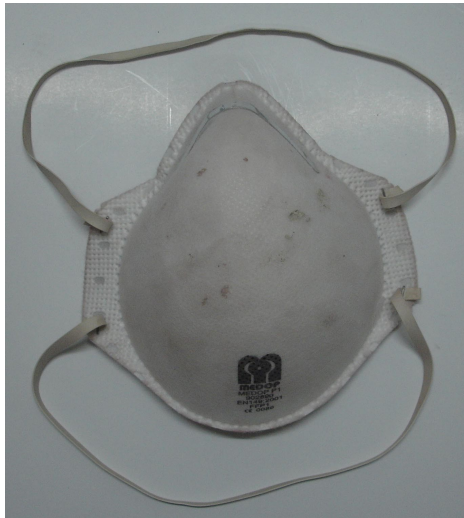
MASCARILLAS Y EQUIPOS DE PROTECCION