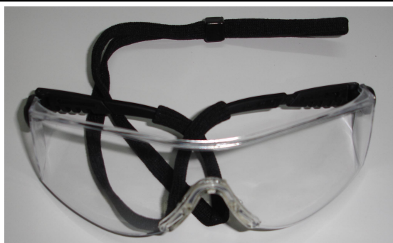
GAFAS DE SEGURIDAD