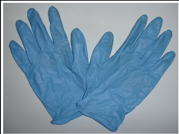
GUANTES DE PROTECCION