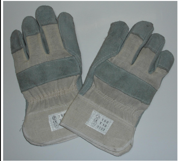
GUANTES DE PROTECCION