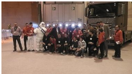
FOTO DOS GANADORES DO CONCURSO NAS DISTINTAS ESPECIALIDADES